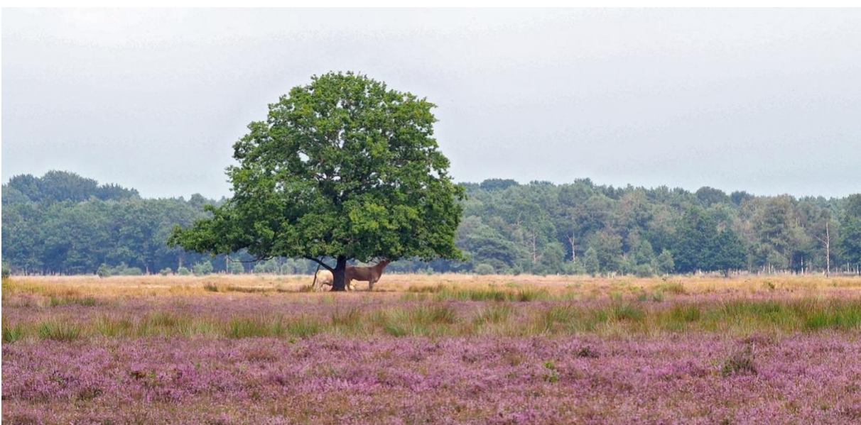
Nieuwe heide op landbouwgrond in Noordenveld bij Dwingelderveld.

We zoeken gezamenlijk naar instrumentarium dat uitgaat van haalbare opgaven, voldoende verdienvermogen voor de ondernemers en dat het realiseren van de gewenste natuurkwaliteit mogelijk en aannemelijk maakt.