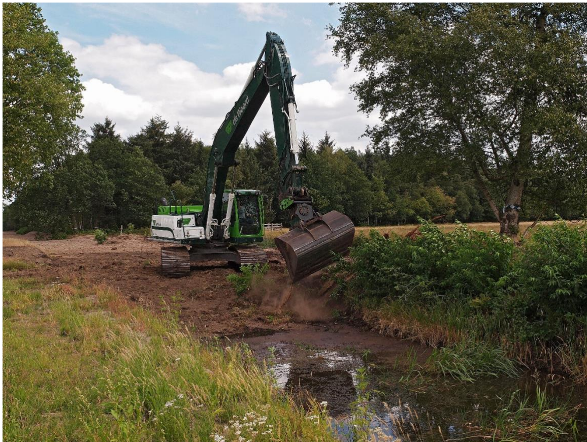
Dichten van de waterlossing bij Tilgrup voor herstel van de waterhuishouding in de Oude Willen (LIFE-project).

Om dat te bereiken voeren we bestaande afspraken onverkort uit. Provincies creëren de randvoorwaarden die nodig zijn om de condities op orde te brengen. Aanvullend treffen we in het beheer en inrichting maatregelen die randvoorwaardelijk zijn voor het bereiken van de gunstige staat van instandhouding van habitats in de Natura 2000 gebieden. We hebben hierbij in het bijzonder aandacht voor hydrologische maatregelen en de rol van de waterschappen, die door de provincies in staat worden gesteld om de noodzakelijke hydrologische maatregelen daadwerkelijk uit te voeren. Als onderdeel van het noodzakelijke natuurherstel besteden we specifiek aandacht aan het belang van stedelijk groen en de verbinding tussen natuur in stad en platteland. Over de bredere VHR-opgave en de inzet die nodig is en de middelen die nodig zijn vanuit de Natuurherstelverordening maken we nadere afspraken met het Rijk. En we instrumenteren de aanpak en opgaven van de Agenda Natuurinclusief.