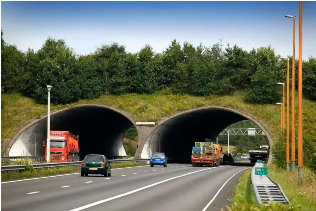
Ecoduct Woeste Hoeve.