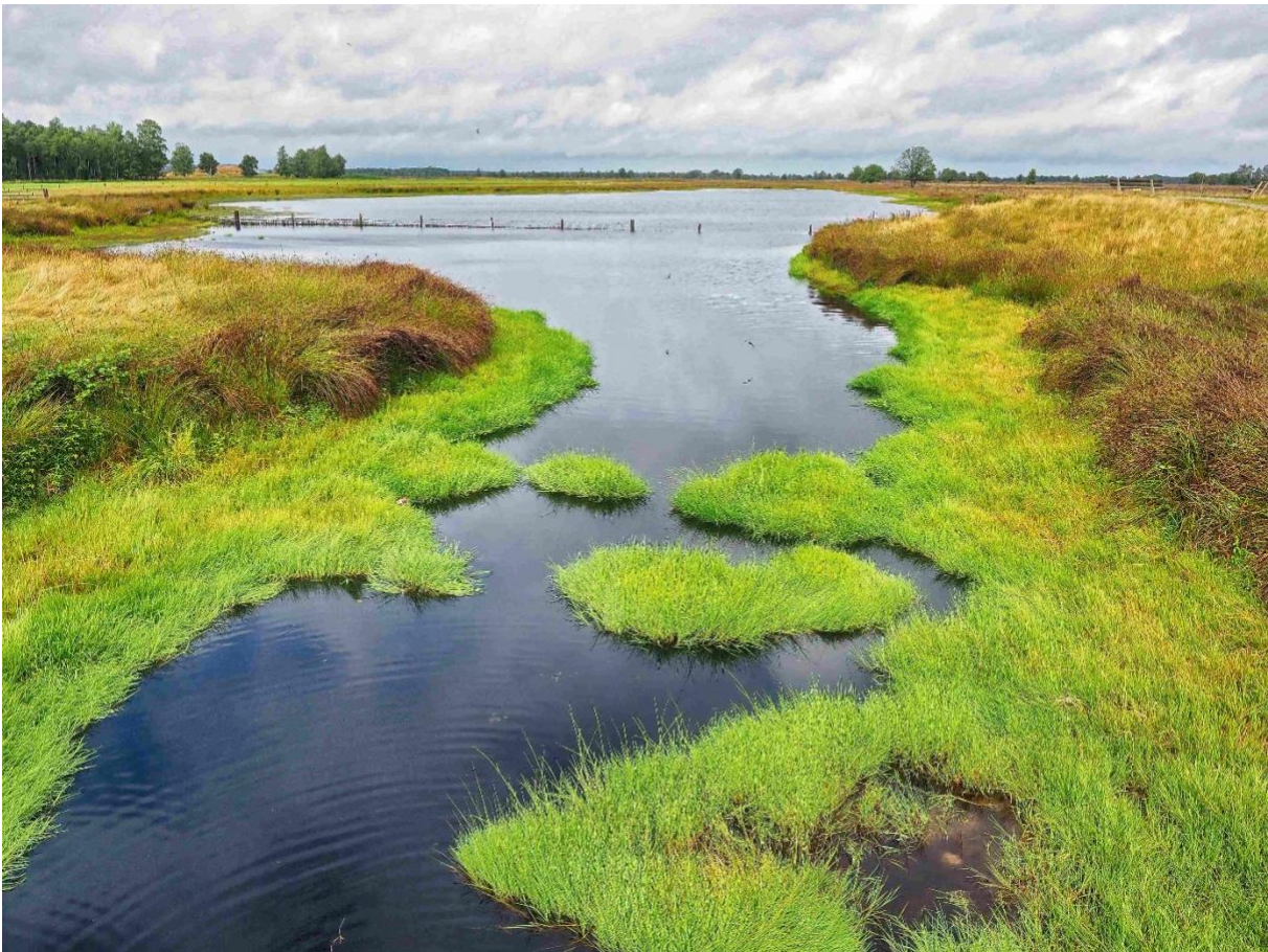
Aangelegde bufferzone bij het hoogveen van het Bargerveen, ter hoogte van Weiteveen.

Ook andere sectoren, zoals de bouw-, de financiële, de energie en de mobiliteitssector, zullen hun bijdrage moeten leveren. De opgaven van de Europese Natuurherstelverordening vragen om inzet in het stedelijke gebied, waar ook gemeenten een cruciale rol spelen en waar stedelijk groen, het versterken van de groen/blauwe structuur en de aanleg van ecologische verbindingzones een bijdrage leveren aan het benodigde natuurherstel. In aanvulling op de aanpak die we hierna schetsen is verbinding met andere sectoren nodig. Daarom werken we aan nadere invulling van de Agenda Natuurinclusief, waarin ook de maatschappelijke bijdrage aan natuur in beeld wordt gebracht. Deze agenda richt zich niet alleen op het landelijke gebied, maar ook op de belangrijke bijdrage van stedelijk groen aan herstel van de biodiversiteit en instandhouding van natuur.