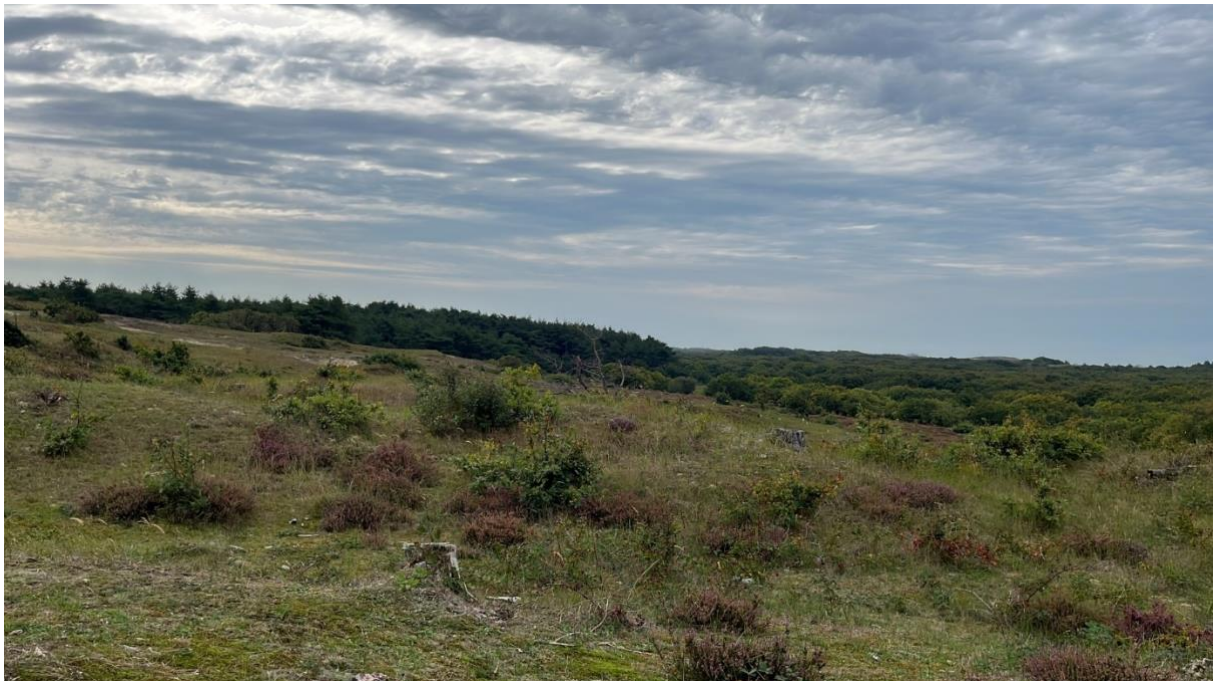
Stikstof zichtbaar in Schoorlse duinen.

4. Borging; professionalisering en monitoring