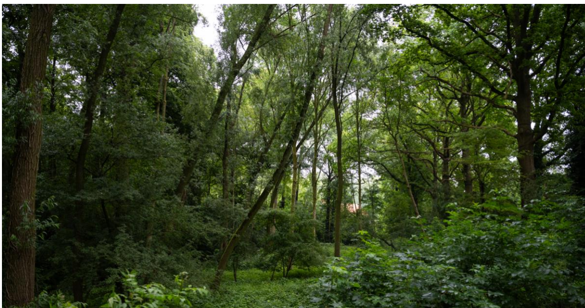
Een dicht, groen bos met hoge bomen en weelderige begroeiing.

Extra natuurherstelmaatregelen zijn nodig om in 2035 90% van de condities op orde te hebben gebracht. We benutten voor de programmering van de maatregelen de structuur van het Programma Natuur, en verbreden deze aanpak. Vergroting van uitvoeringscapaciteit is essentieel om tot uitvoering te komen, dit geldt ook voor de gemeentelijke uitvoeringscapaciteit die nodig is om natuurrealisatie en groenbeheer in de overgang naar de stedelijke zones te versterken.